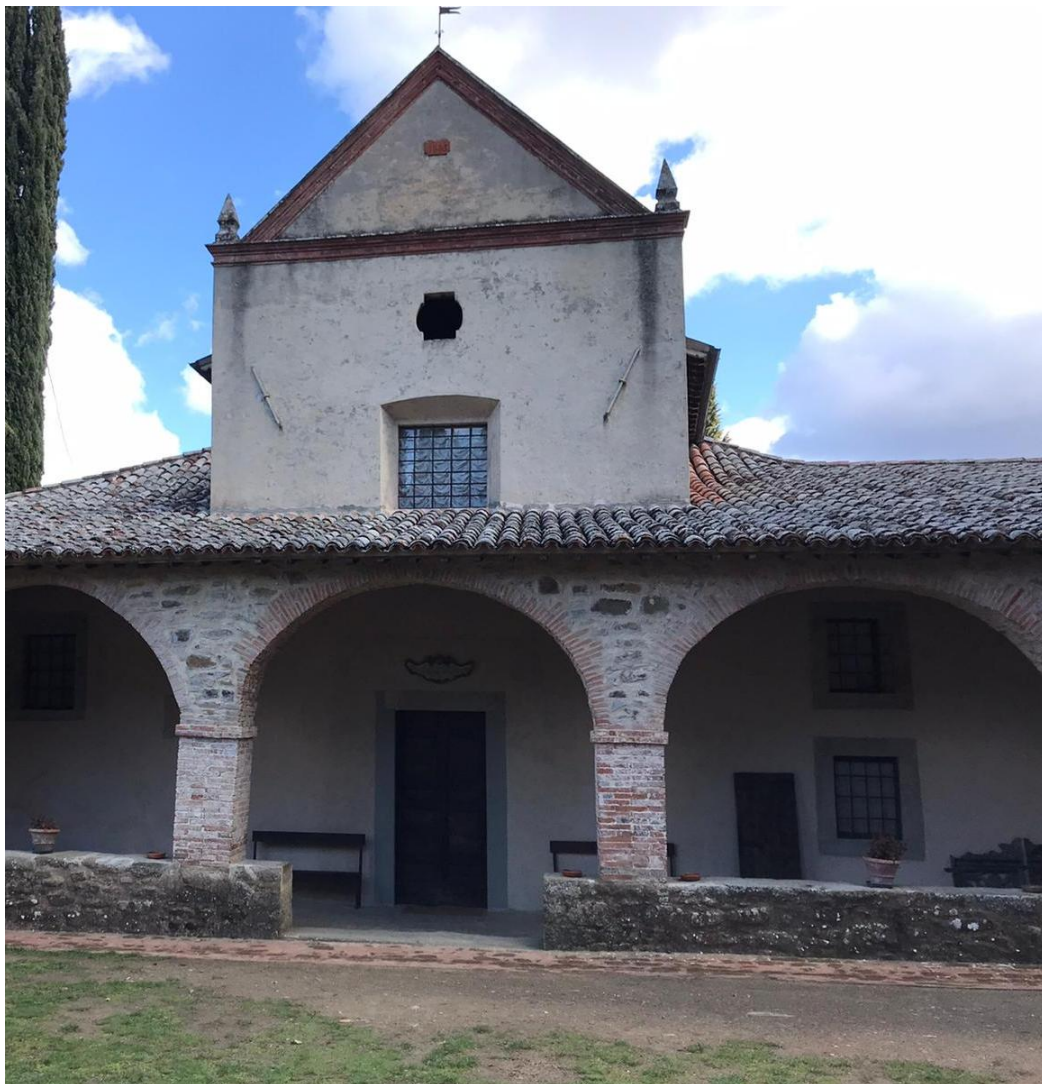
Chiesa della Scarzuola (loc. Montegiove nel Comune di Montegabbione - TR)